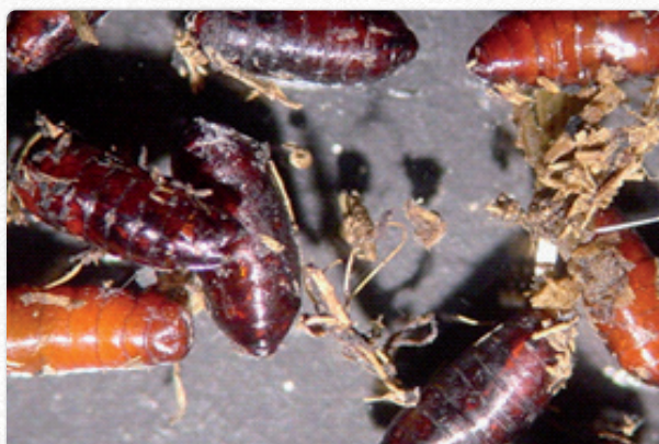
Pupes de mouche (taille réelle 6 mm)